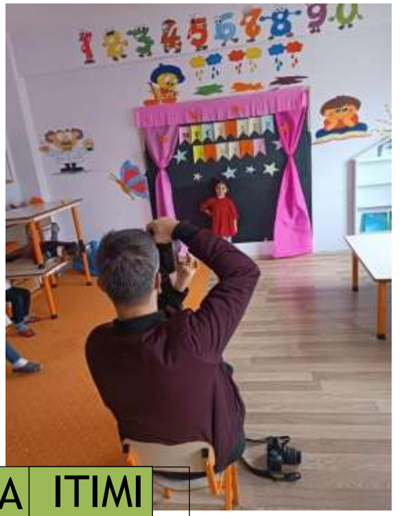
MESLEK TA İTİMİ