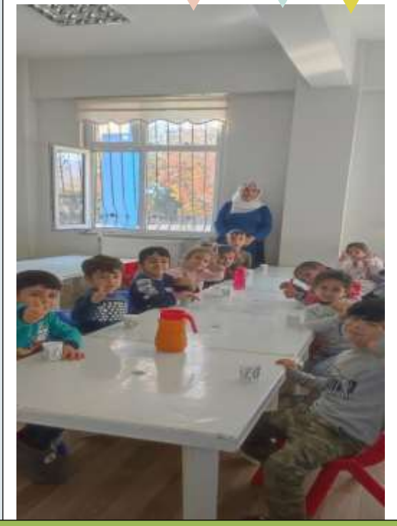
PORTAKAL SUYU YAPMA